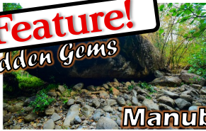
Manubo Stone Brgy. Paiton