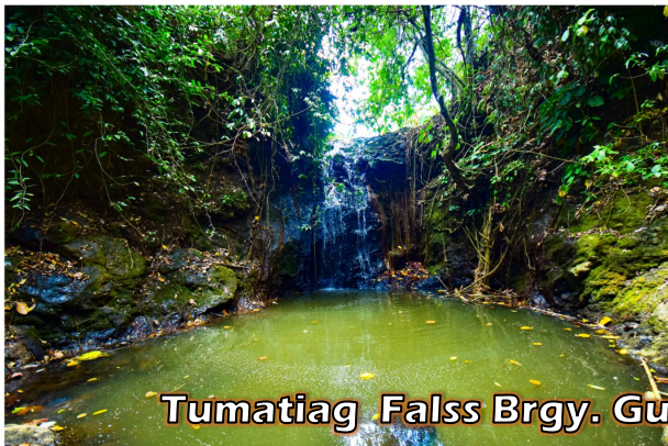
Tumatiag Falls Brgy. Guinalaban