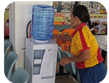
New Installed Water Dispenser at Asenso Mall 1 Food court & Asenso Mall 2 Dry goods.